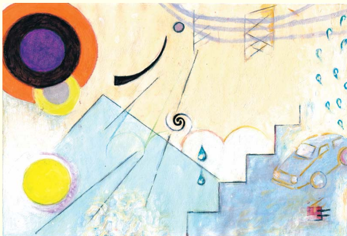
Illustration: Kiraki Hendahl